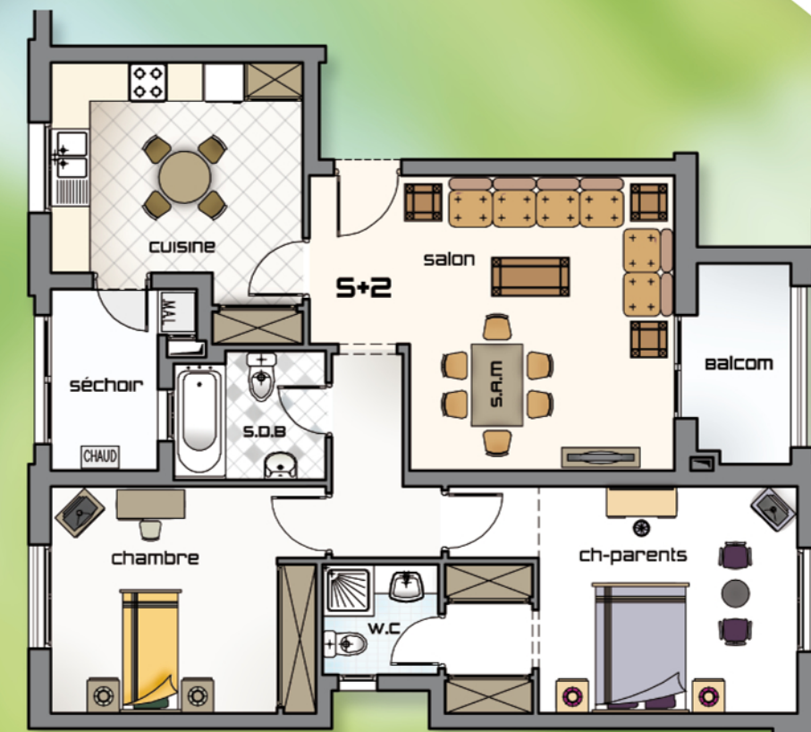
Appartement Type S+2 de 115 à 136 m 2