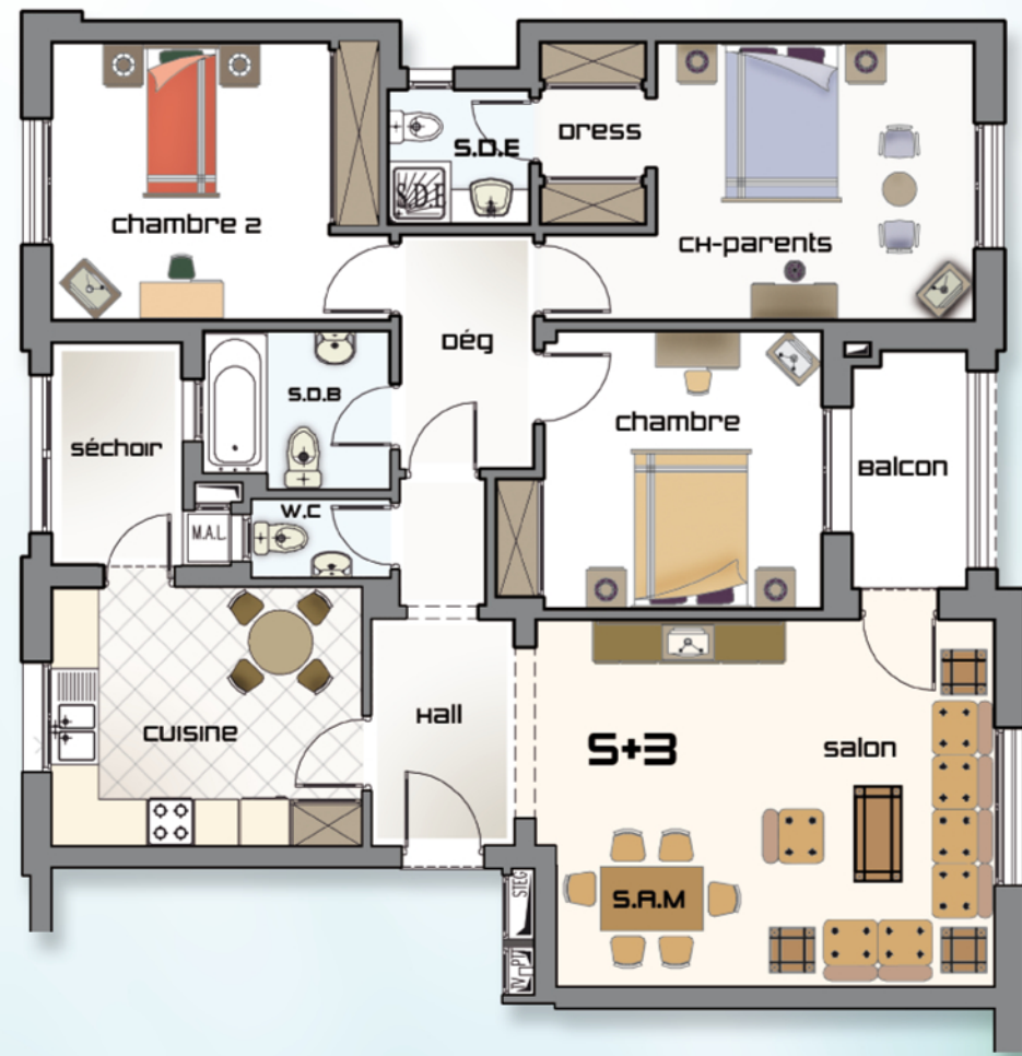
Appartement Type S+3 de 148 à 158 m 2